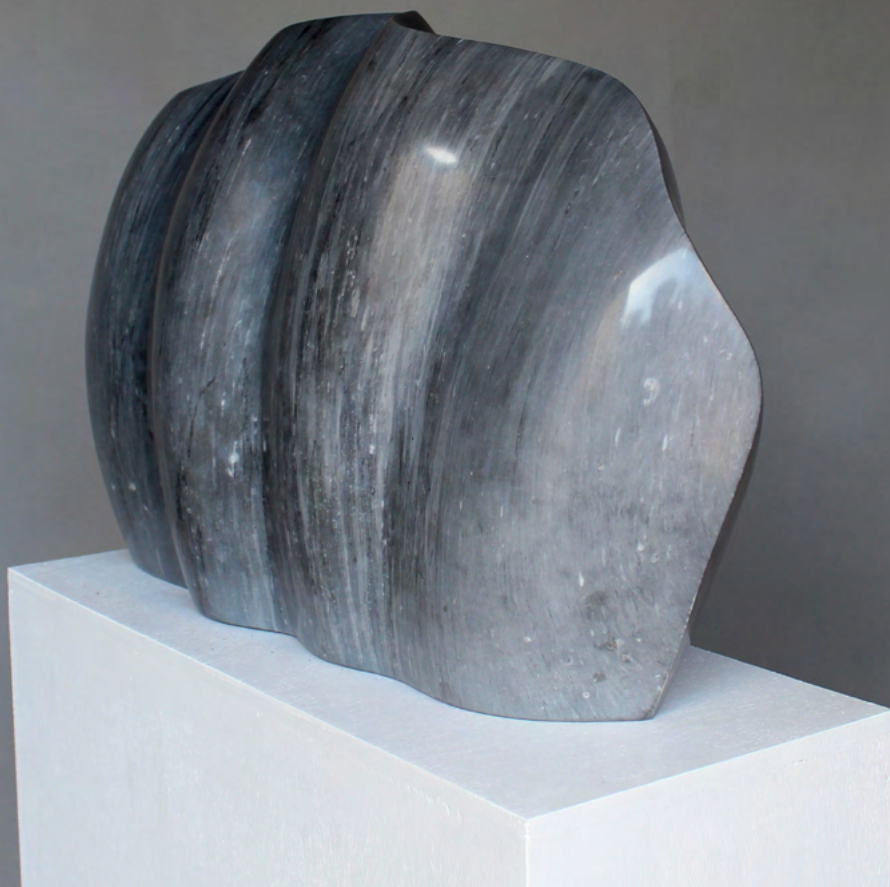
EOLE 3 2015 Marbre gris d'Italie 31 × 46 × 16 cm