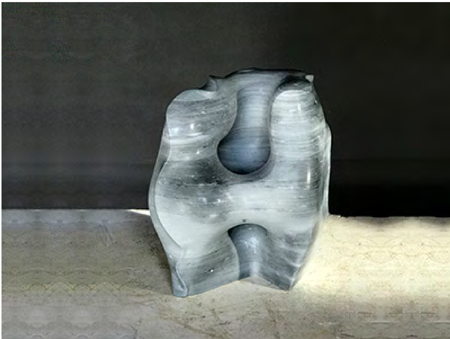
EDIFIER 2020 Marbre gris Italie 30 × 23 × 23 cm