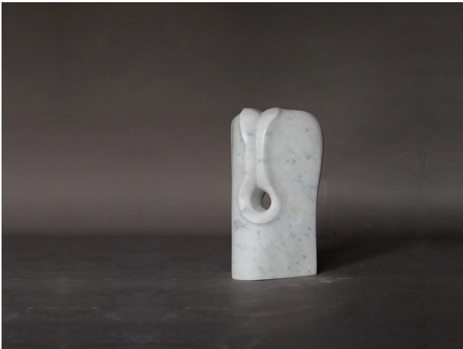
EPANOUISSEMENT 2022 Marbre blanc de Carrare Italie 22 x 14 x 9 cm