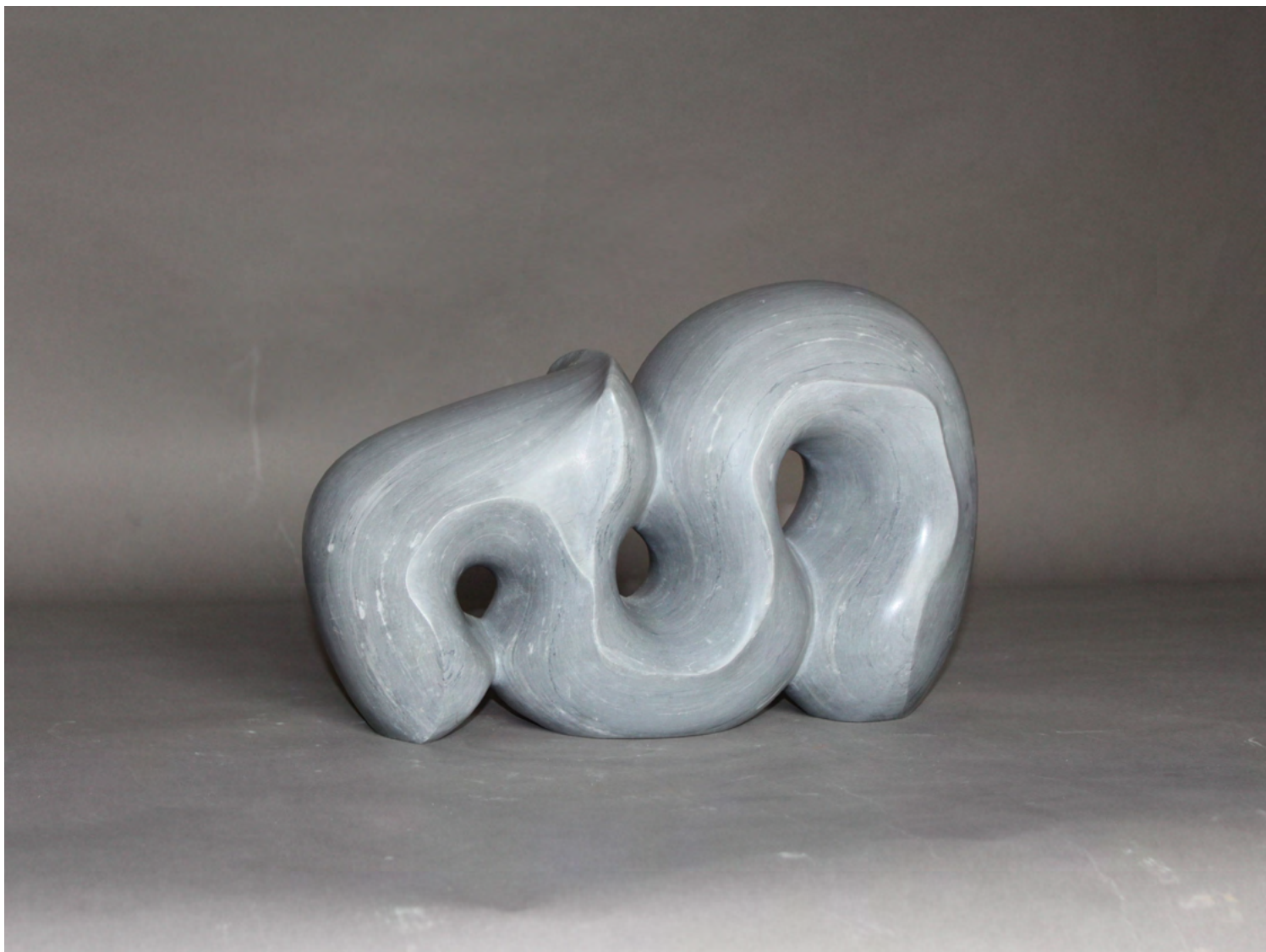
GENESE 2022 Marbre gris d'Italie 26 x 39 x 17 cm