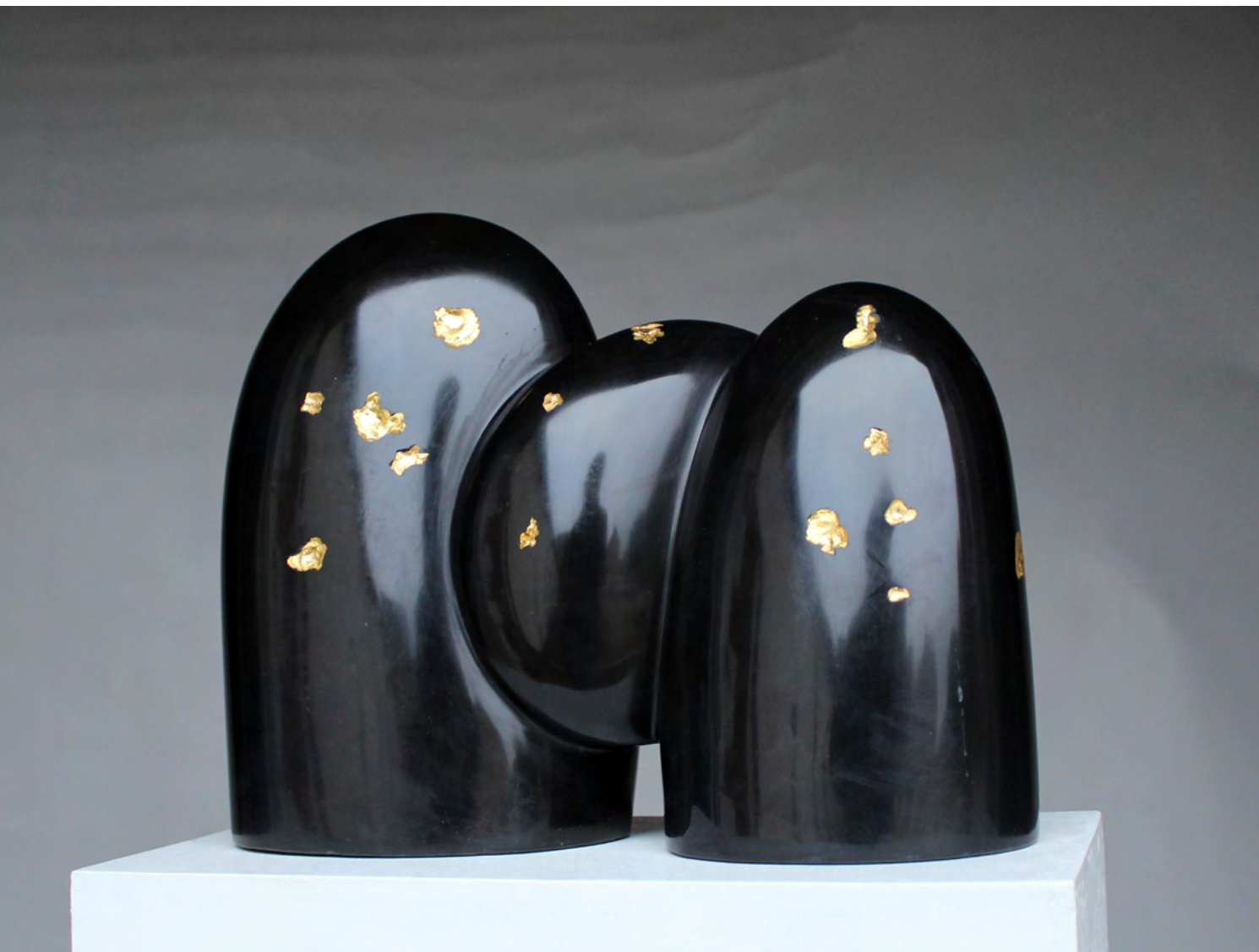
MONTAGNE NOIRE 2 2016 Granit noir d'Afrique et feuilles d'or 24 × 30 × 10 cm