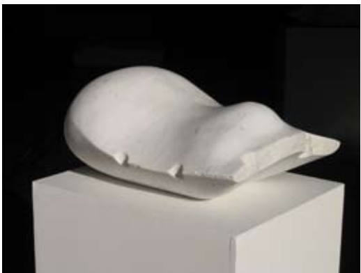
2 - Abdomen - 2007 - 41x31x20 Marbre blanc d'Italie